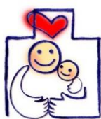
愛知ファミリー・フレンドリー企業