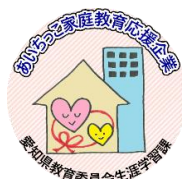
あいちこ家庭教育応援企業