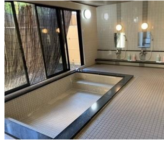
浴室（男女各 1 室）