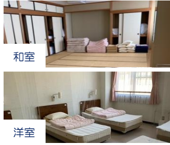
宿泊室（最大 180 人）